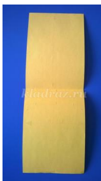
Шаг 1: (Слайд №5)